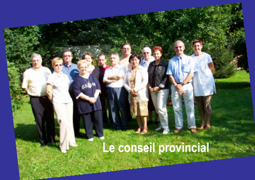
Le conseil provincial

SALESIEUNE COOPERATRICE, SALESIEUN COOPERATEUR,